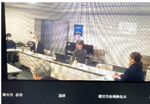
PC画面で観る労働安全衛生学校の様子

神奈川労連、神奈川民医連、働くもののいのちと健康を守る神奈川センターが主催する“働くものの労働安全衛生学校”が11月9日（土）に建設プラザかながわで開催されました（Zoom参加併用）。